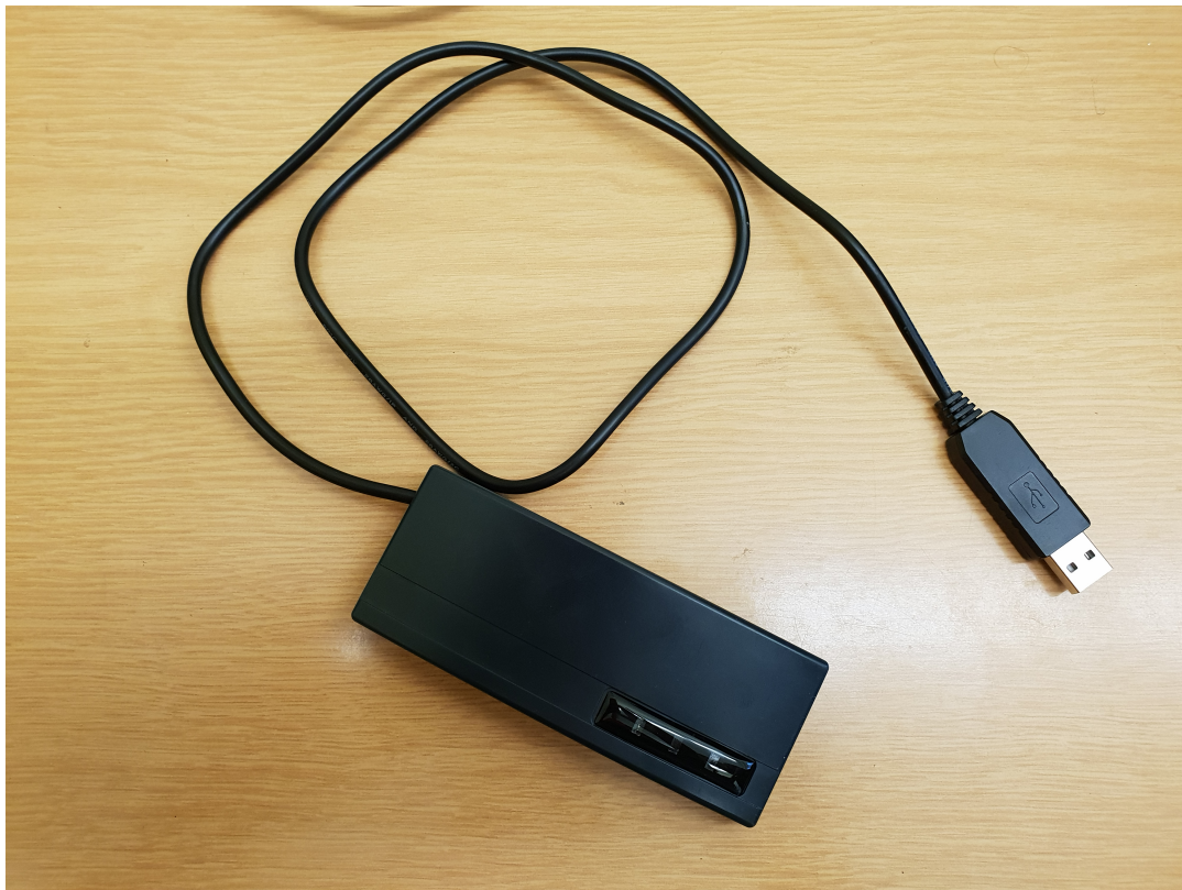
Asztali USB RFID olvasó