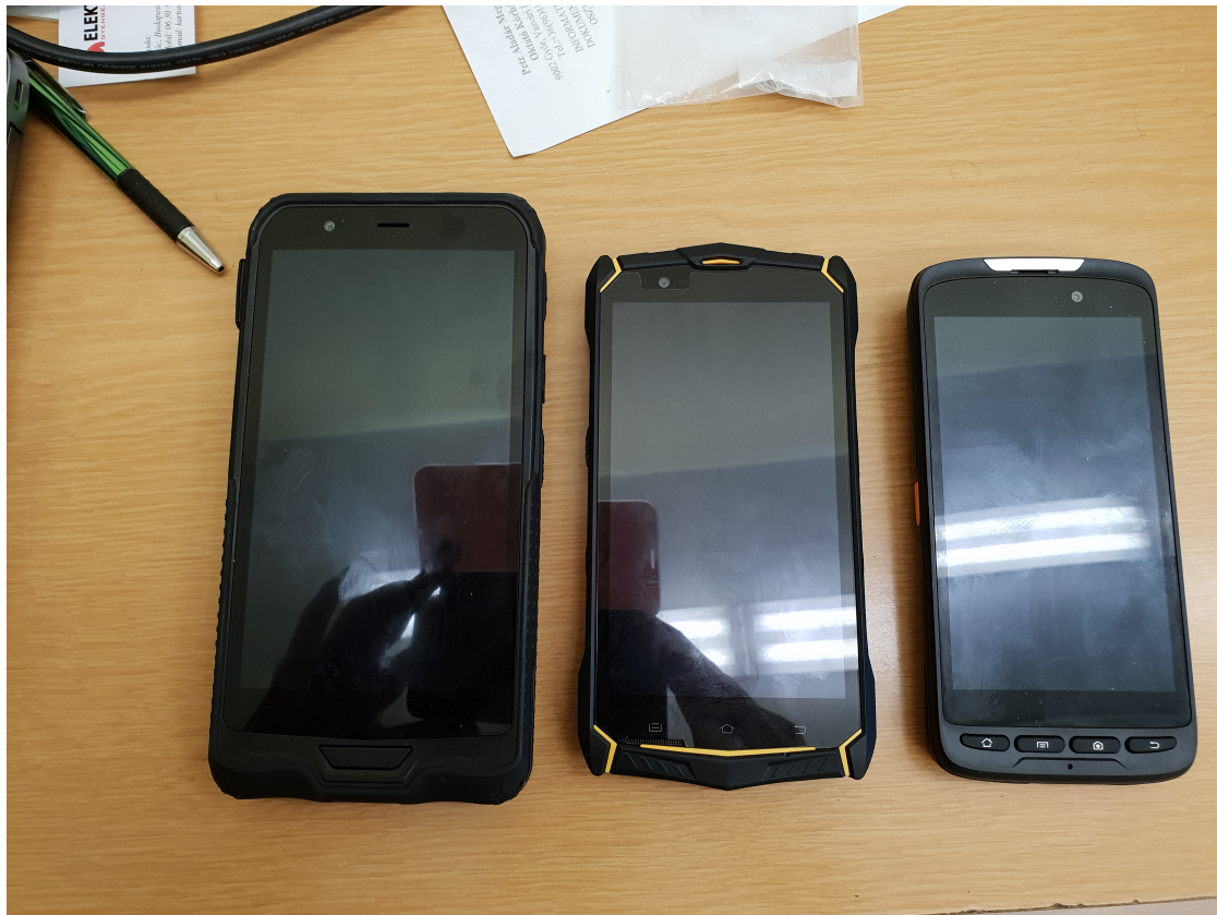
Mobil NFC olvasó