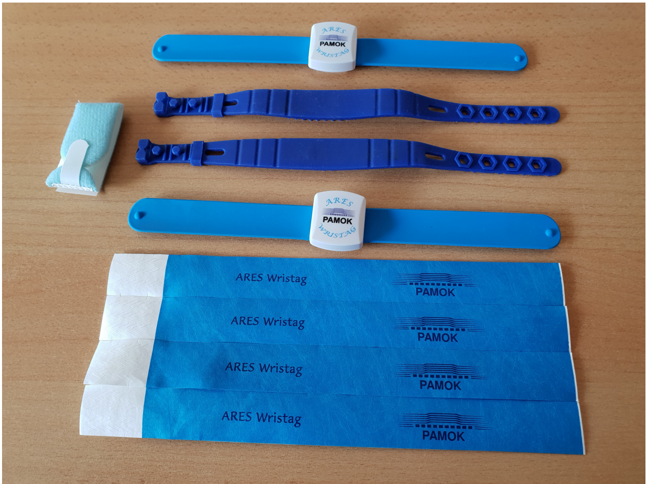
UHF RFID+NFC speciális karszalagok (egyszer használatos, újrafelhasználható)