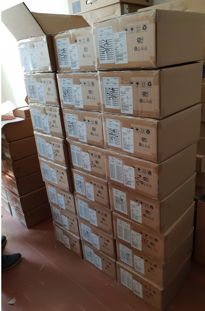
HPE Wifi accesspoint