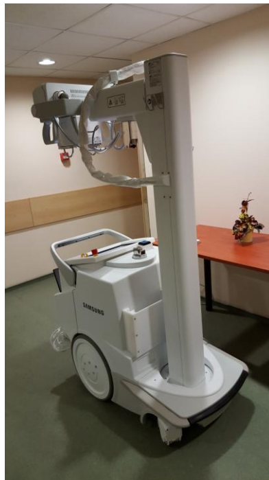
Mobil röntgen készülék digitális panelrel (2 darab)