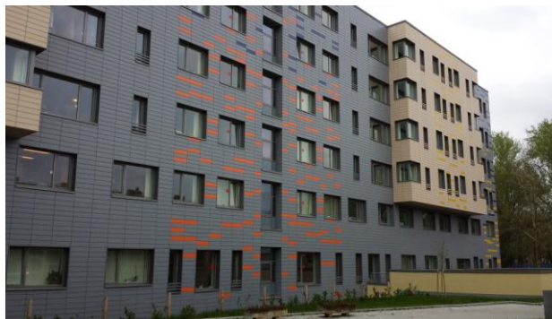
Az Onkológiai Centrum helyt adó bunker épülete