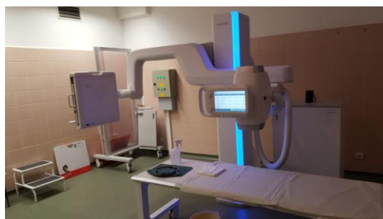
"U" vagy "Z" karos direkt digitális röntgen felvételes készülék (2 darab)