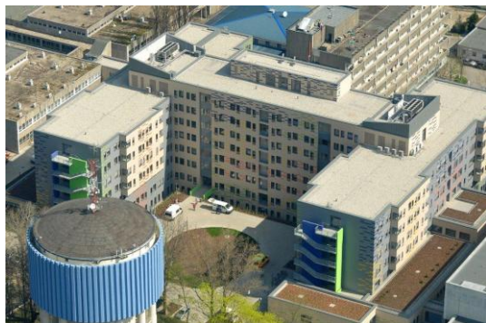
Az új hotelépület

A projekt keretében beszerzett berendezések nagy része a TIOP 2.2.7/2F/2-2009-0010 projekt keretében megújult épületben („B” épület) kerültek elhelyezésre, az orvotoltos besugárzó készülék pedig az új hotelépületében, az onkológiai bunkerben kapott helyet.