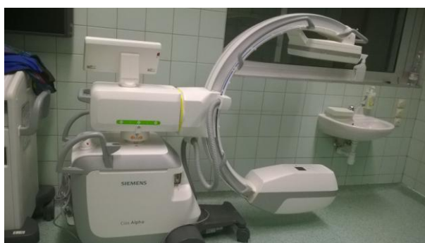
Mobil képerősítő DSA funkcióval (1 darab)