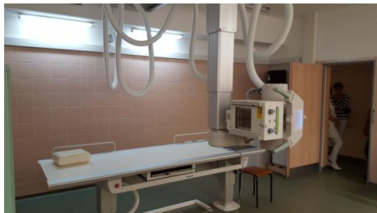
Digitális röntgenfelvételi készülék 2 digitális panelrel (3 darab)