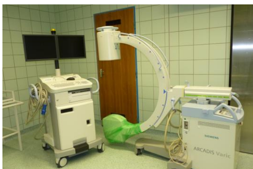
Sebészeti mobil képerősítő DICOM képparchiválással (2 darab)