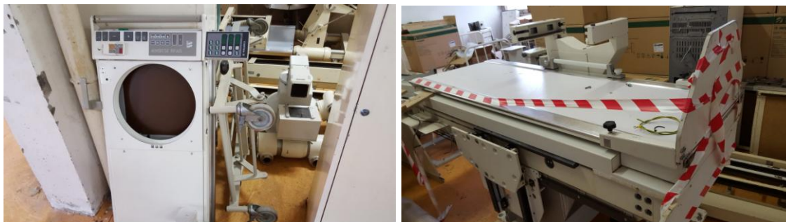
Fejlesztés előtti eszközpark

A diagnosztikai berendezések ezen belül a röntgen berendezések döntő része az utolsó nagy kórházépítési periódusban, a 80-as évek közepén kerültek telepítésre. Ezeknek a berendezéseknek az átlagéletkora 15 év feletti, többségük teljesen elavult, a röntgen berendezések saját energiafelhasználása mellett a foszforlemez kiolvasók is energia felhasználók.