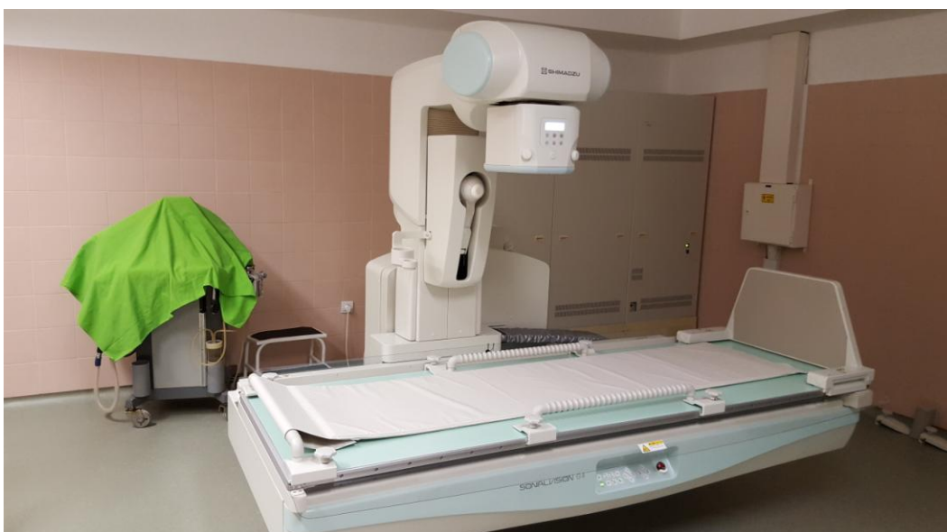
Digitális átvilágító készülék (1 darab)

A projekt keretében 12 darab eszköz beszerzése valósult meg az alábbiak szerint: