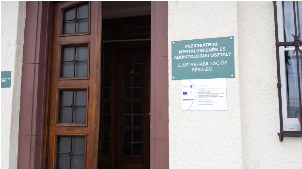
„D” típusú tájékoztató tábla Tét, Győri úti telephelyen