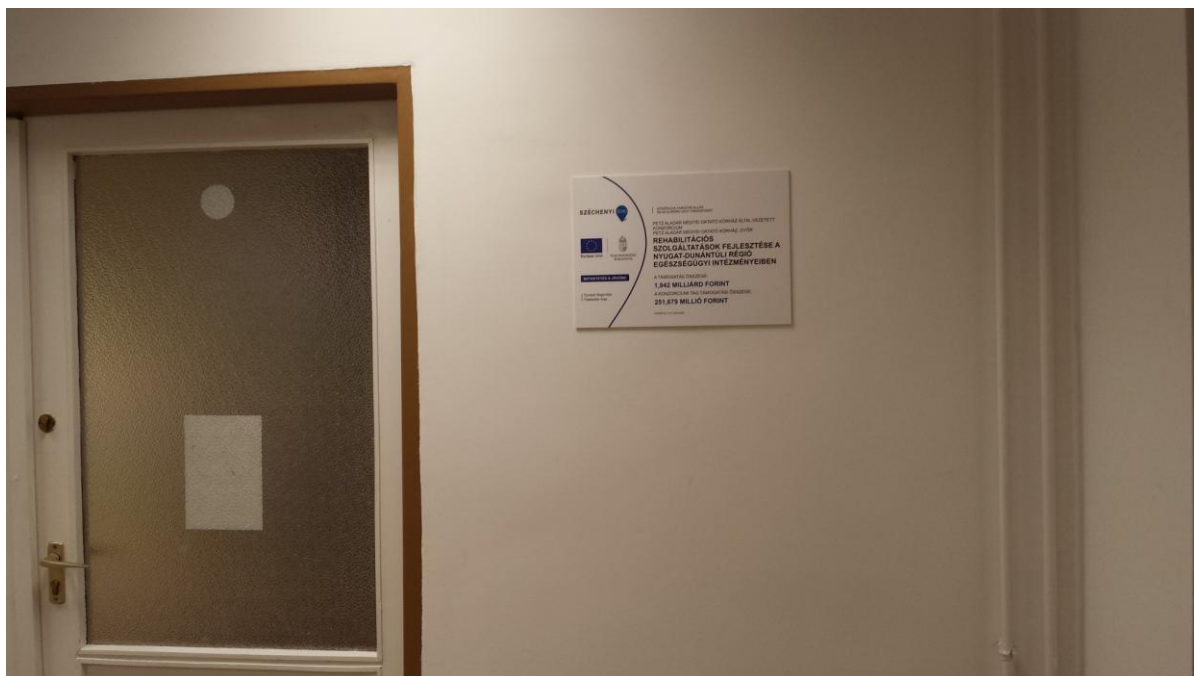
„D” típusú tájékoztató tábla Győr, Vasvári Pál utca 2-4. telephelyen „E” épület